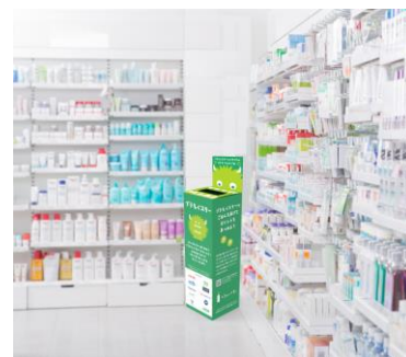
回収店舗イメージ

https://www.terracycle.com/ja-JP/brigades/jacdscep