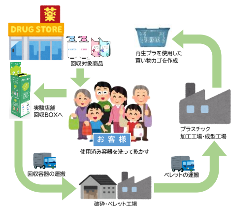
回収スキーム（店頭での回収から再生品作成の流れ）